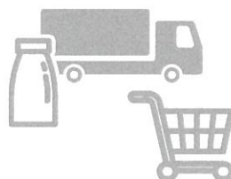
加工・流通・販売