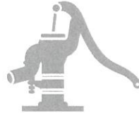
農業用の井戸・水道